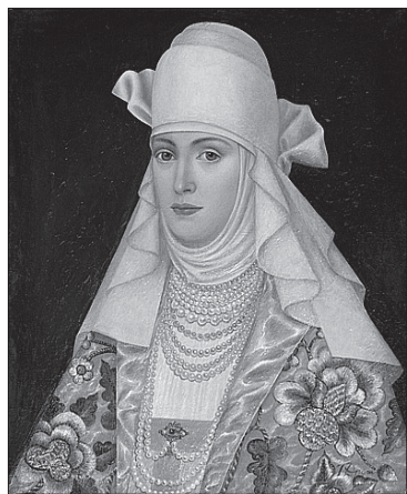
«Портрет» авторства Тамари Дружини

Серед численних експонатів представлені і «мешканці» запорізьких скарбниць. Національний заповідник «Хортиця» надав для виставки три козацькі люльки XVIII століття [одна з них знайдена на Кам'янській Січі – на цю пам'ятку національного значення у лютому минулого року росіяни скинули бомби], а також цифрову копію картини «Богдан Хмельницький з полками».