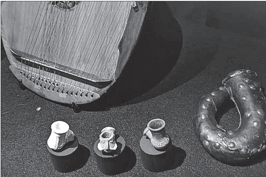
Національний заповідник «Хортиця» надав для виставки три козацькі люльки XVIII століття

Посполитої, і той прапор потрапив у якості трофея вже до них. Таким чином цей артефакт і був збережений».