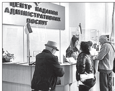
Центру надання адміністративних послуг та його територіальних підрозділів».

громадян, які здійснюють догляд за іншими людьми], а також для усіх, хто фактично проживає у нашому місті, але не має відповідної реєстрації і має потребу у вищезгаданій довідці. Відтепер не потрібно ходити різними інстанціями, а достатньо просто звернутися з письмовою заявою до міського